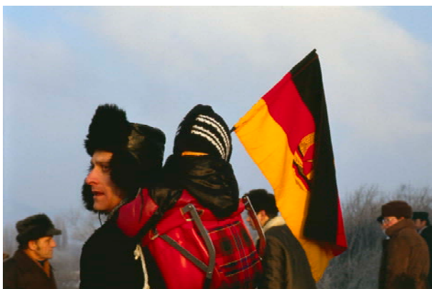
Aus / from: Seiichi Furuya. Mémoires. 1984 – 1987. East Berlin 1987.

Die honorarfreie Veröffentlichung ist nur in Zusammenhang mit der Berichterstattung über die Publikation gestattet und auf zwei Abbildungen beschränkt. Wir ersuchen Sie, die Fotografien vollständig und nicht in Ausschnitten wiederzugeben. Bitte betiteln Sie die Fotografien nach den beigestellten Angaben.