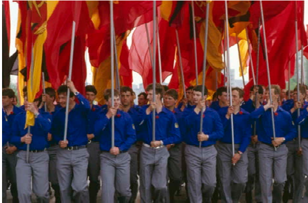
Aus / from: Seiichi Furuya. Mémoires. 1984 – 1987. East Berlin 1987.