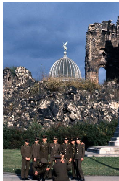
Aus / from: Seiichi Furuya. Mémoires. 1984 – 1987. Dresden 1984.