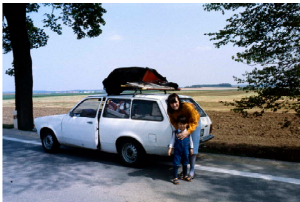
Aus / from: Seiichi Furuya. Mémoires. 1984 – 1987. Czechoslovakia (Wien – Dresden). 19. Mai 1984.