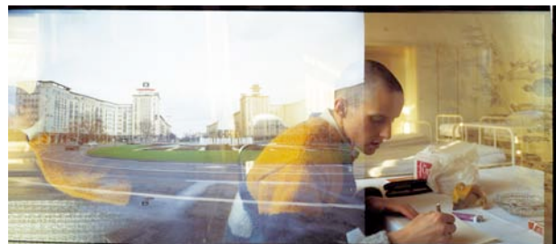
Aus / from: Seiichi Furuya. Mémoires. 1984 – 1987. Graz/East Berlin 1985.