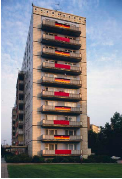
Aus / from: Seiichi Furuya. Mémoires. 1984 – 1987. East Berlin 1986.