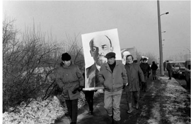
Aus / from: Seiichi Furuya. Mémoires. 1984 – 1987. East Berlin 1987.