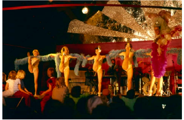
Aus / from: Seiichi Furuya. Mémoires. 1984 – 1987. East Berlin 1987.