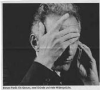
Börsen-Panik. Ein Absturz, zwei Gründe und viele Widersprüche.