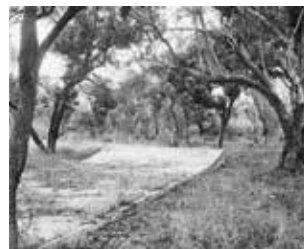
Mass grave at Cassinga I, 2010.