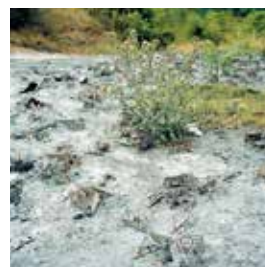
Destroyed Files, Bosnia Herzegovina / zerstörte Ordner, Bosnien und Herzegovina, 2006.