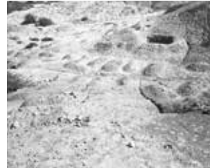
Hillside graves near Dombe Grande, 2010.