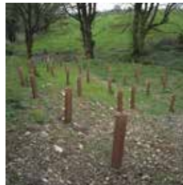
Plantation / Pflanzung, Armagh Louth Border, 2006.