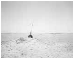
Unidentified memorial in the desert, south of Namibe I, 2009