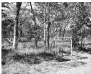
In the forest on the road to Jamba, 2010.

Ungekennzeichnetes Massengrab in der Umgebung von Cuito Cuanavale, 2009.