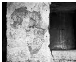
Mural in an abandoned schoolhouse, Ompapa, 2010.

Wandmalerei in einem verlassenen Schulgebäude, Ompapa, 2010.