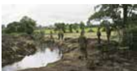
British Army fortifications pre- venting an Orange Order March / Befestigungen der Britischen Armee, um einen Protestmarsch des Orange Order, einer protes- tantischen Organisation in Nord- Irland, zu verhindern, Drumcree, Portatown, 2006.