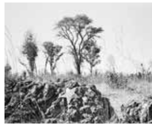
Unmarked mass grave on the outskirts of Cuito Cuanavale, 2009.

Auf der Straße nach Cuito Cuanavale IV, 2009.