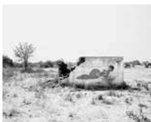
Comfort Station, Military base, Lobito, 2010.

Wandmalerei in einem verlassenen Schulgebäude, Ompapa, 2010.