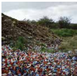
Shotgun cartridges / Patronen von Schrotflinten, Armagh Louth Border, 2006.