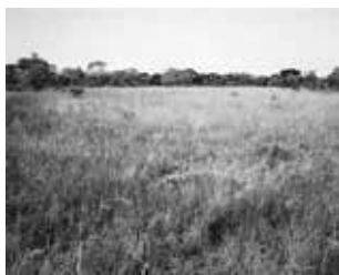
Minefield near Mupa, 2009.