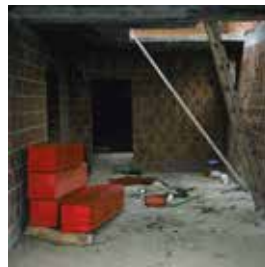
Red Coffins / Rote Särge, Glogjani, Kosovo, 2006.