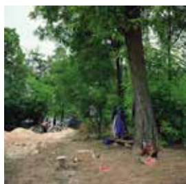
Men Digging, Pristina, Kosovo: On April 2, 1999 a Kosovar Albanian claimed to have seen truckloads of dead bodies accompanied by three or four armoured vehicles in a gra- veyard in Pristina / Ausgrabung, Pristina, Kosovo: Am 2. April 1999 behauptete ein kosovarischer Alba- ner, Wagenladungen von Toten in einem Friedhof in Pristina gesehen zu haben, begleitet von zwei oder drei gepanzerten Fahrzeugen, 2006.