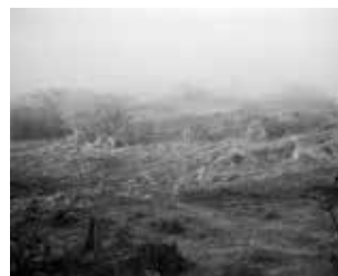
Battlefield near Caiundo on the way to Savate, 2009.

Schlachtfeld in der Nähe von Caiundo am Weg nach Savate, 2009.