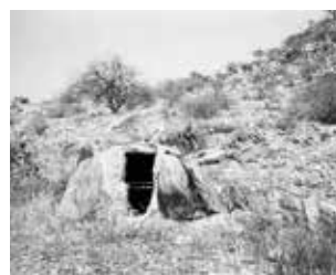
Military cache south of Dombe Grande, 2010.

Militärlager südlich von Dombe Grande, 2010.