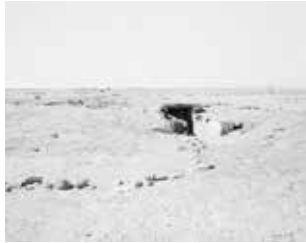
Bunker, Cuban base, Namibe, 2009.