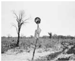
On the road to Cuito Cuanavale IV, 2009.

As Terras do Fim do Mundo [The Lands of the End of the World], 2009-10.